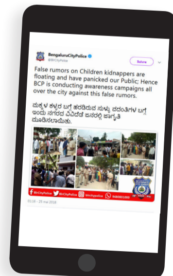
twitter.com, 25 mai 2018, message @BlrCityPolice

En 2018, en Inde, des rumeurs circulent, notamment par des réseaux sociaux, sur de supposés enlèvements d'enfants. Elles déclenchent une vague d'agressions, parfois mortelles, contre des innocents souvent désignés parmi les pauvres et étrangers – issus d'un autre État, d'une autre religion ou d'une autre langue. Les lynchages, fréquents à d'autres périodes de l'histoire et que l'on croyait révolus, sont des comportements de foule encore actuels.