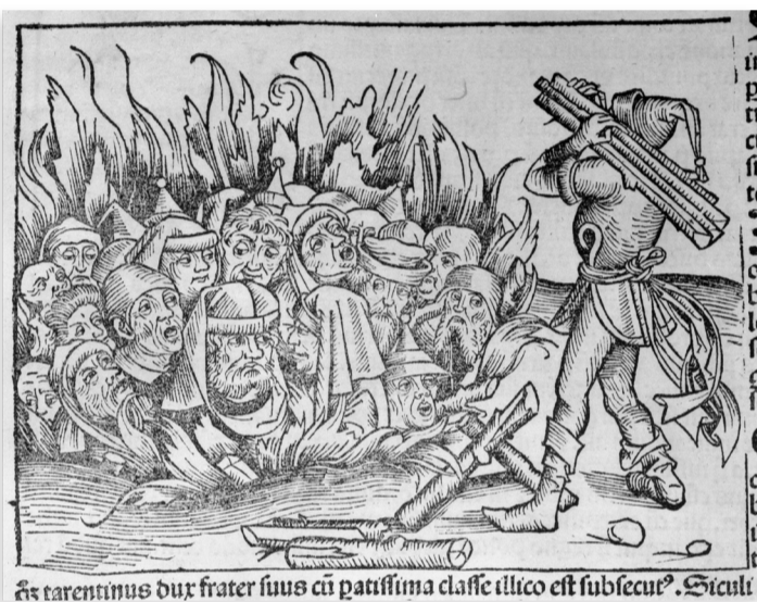
Représentation caricaturale de citoyens juifs brûlés sur un bûcher Chroniques de Nuremberg, 1493

En 1893, une querelle éclate à Aigues-Mortes entre ouvriers français et italiens sur un chantier de la Compagnie des Salins du Midi. Une rumeur se propage selon laquelle trois Français auraient été tués. Dans un contexte de xénophobie exacerbée, cette infox déclenche un véritable massacre contre les Italiens, causant une centaine de victimes.